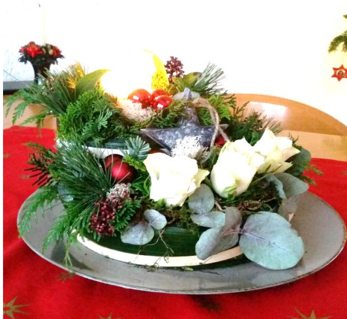
kerststuk van 2018

Wanneer : woensdag 11 december 2019 Tijd : 14.00 tot ± 16.00 uur Waar : De Schouw Kosten : € 15.00 + (€ 0.50 voor koffie/thee)