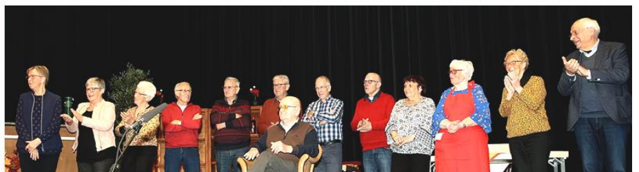
Foto's van de bonte middag