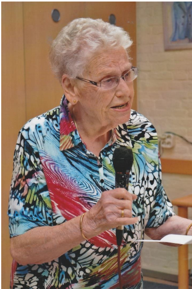
Cootje bij haar afscheid van 'Zanglust', De Schouw, 8 juni 2015; fotografie: Elly Heesterbeek.

Het onderwerp laat zich raden: Aruba. Op dinsdag 14 november 2017 sprak ik zijn moeder in appartementencomplex 'Waranda', waar zij sedert 2010 woonachtig is.