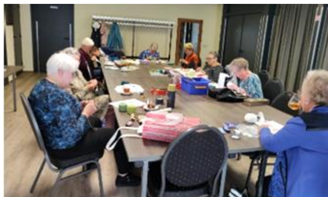
De hobbyclub in de Tussenzaal