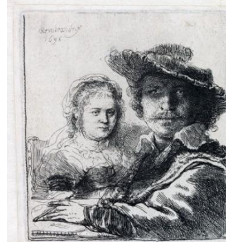
Zelfportret met Saskia (ets)

In Amsterdam leerde Rembrandt Uylenburgs nichtje Saskia kennen, met wie hij in 1633 trouwde. In 1635 betrokken Saskia en Rembrandt hun eerste eigen woning in de Nieuwe Doelenstraat. Na drie jonggestorven kinderen kregen ze in 1641 een zoon, Titus, genoemd naar Saskia's zuster Titia. In 1639 hadden ze een kapitaal pand in de Sint-Antoniesbreestraat (nu het Rembrandthuis) gekocht, naast de zaak van Van Uylenburch.