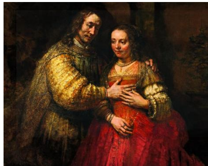
Het Joods Bruidje

van trouwbeloften en de hoogte van een alimentatie. Rembrandt kreeg gedaan dat zij op zijn kosten werd opgesloten in het spinhuis. In 1647 was de jonge Hendrickje Stoffels bij Rembrandt komen wonen, die hij beschouwde als zijn 'huysvrouw'. Ze kregen in 1654 een dochter, Cornelia, zonder dat ze waren getrouwd, want de erfenisbepalingen van Saskia maakten dat niet mogelijk. Hendrickje bleef tot haar dood in 1663 lief en leed met Rembrandt en Titus delen.