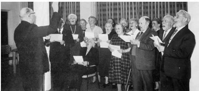
Eer Zanglust zong

Het nieuwe Kempische bejaardencentrum is een leefbaar gebouw geworden met een gemeenschap, die op elkaar is ingespeeld. De eerste dagen in dit moderne tehuis verliepen natuurlijk wel wat stroef. Maar binnen enkele weken hadden de bejaarden zelf al hun ontspanningsvereniging opgericht. De bejaarden zelf organiseren nu hun 'eigen wereldje', zoals de jaarlijks terugkerende feestdagen: een sinterklaasavond, een kerstavond enzovoorts. Menige bewoner