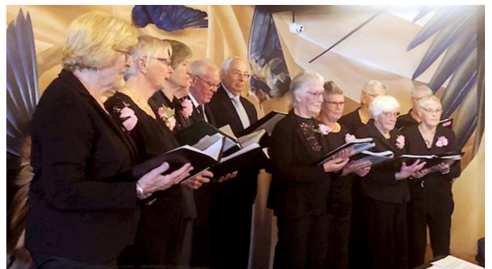
Seniorenkoor Zanglust op de Korendag

Op woensdag 12 oktober verzorgden vijf seniorenkoren uit de regio een prachtige muzikale voorstelling in hotel/brasserie De Beerze te Middelbeers. De organisatie was in handen van het plaatselijke seniorenkoor Zang Doet Leven. De dag werd financieel ondersteund door LOVOK, de landelijke organisatie van ouderenkoren. De Korendag was perfect georganiseerd door Zang Doet Leven. De deelnemers bewezen overtuigend dat muziek mensen verbindt en ouderen echt samenbrengt. Niet het presteren maar vooral het plezier beleven in zingen met elkaar en de ontmoeting met koorleden van andere verenigingen, bleken een schot in de roos. Er werd dan ook prachtig gezongen door De Naklank uit Oirschot, Zang en Vriendschap uit Hilvarenbeek, Levenslust uit Hapert, Zang Doet