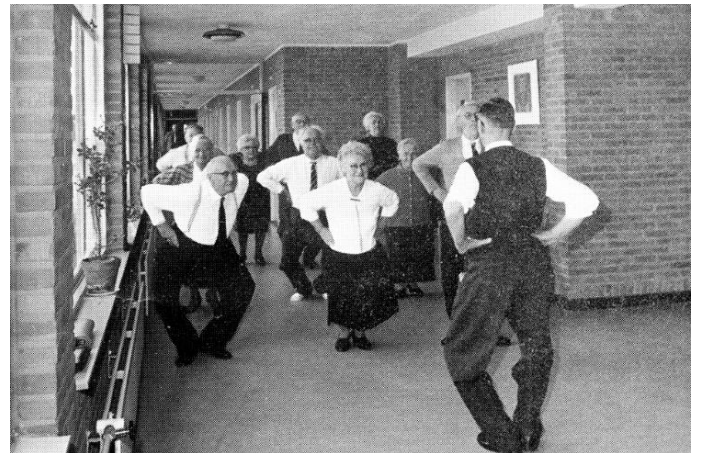
Gymmen in de gang

Het bestuur van de stichting R.K. Bejaardenzorg Bladel is bijzonder dankbaar voor het vele werk dat belangeloos werd en wordt gedaan om het nieuwe bejaardencentrum tot een leefbaar en prettig tehuis te maken. Daarom stelde het bestuur een 'college van eregasten' in om personen, die op bijzondere wijze het bejaardencentrum en zijn bewoners een warm hart toedragen, te onderscheiden. De uitverkiezing tot lid van dit college houdt in dat men in alle opzichten als eregast van het tehuis zal worden beschouwd. Twee personen