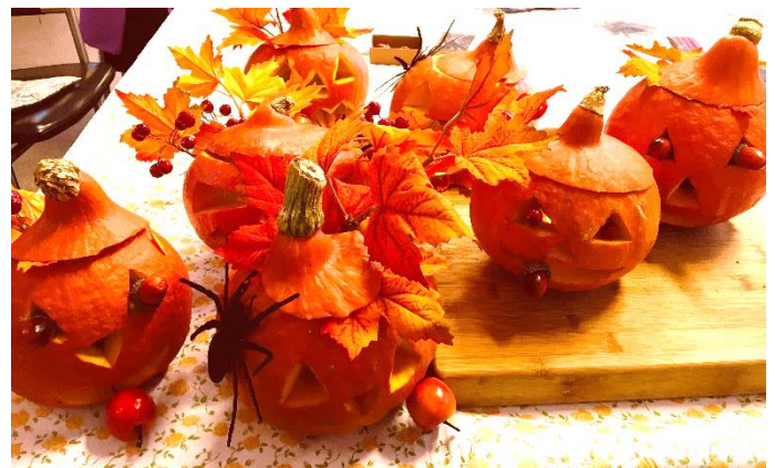
De verschrikkelijke halloweenpompoencreaties.

Woensdag van 10.00-12.00 Bladel Locatie de Schouw bij Den Herd