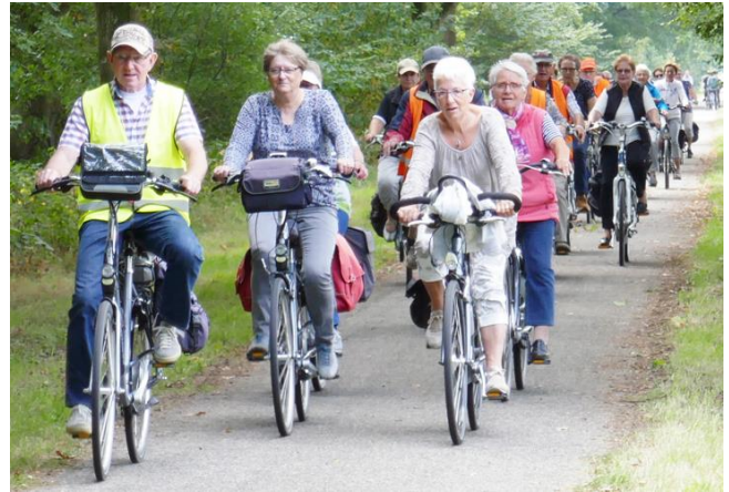
De fietsers op het Bels Lijntje

In Alphen hebben we geluncht. Hier wisten ze dat we kwamen en de soep stond klaar. Iedereen die een kop soep wou kon dit zelf opscheppen.