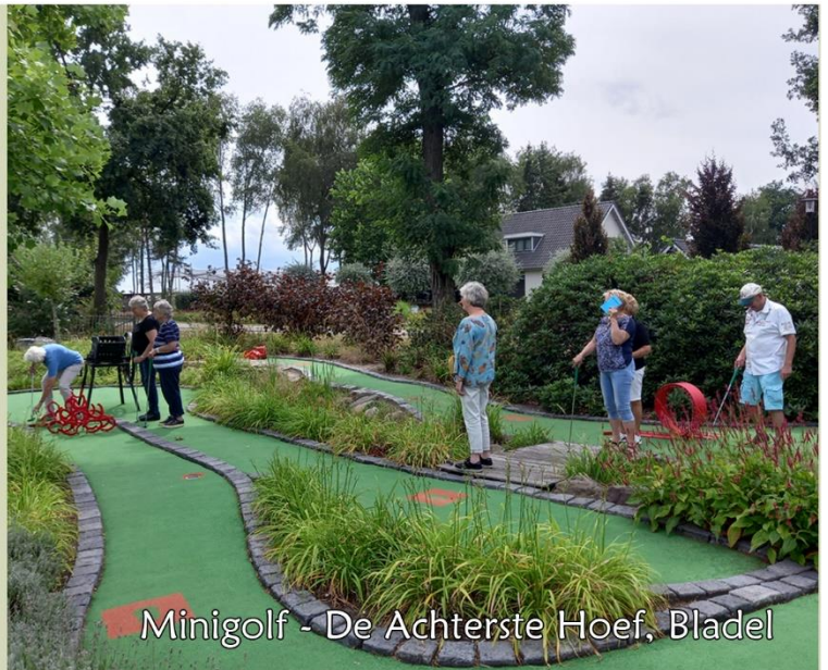
Minigolf - De Achterste Hoef, Bladel