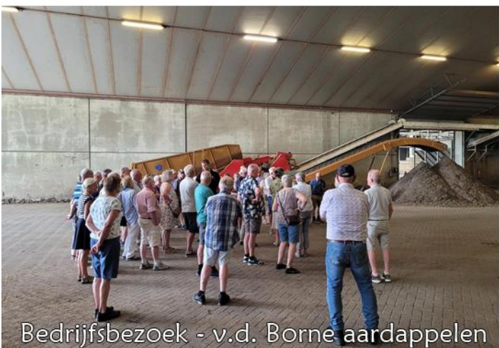
Bedrijfsbezoek - v.d. Borne aardappelen