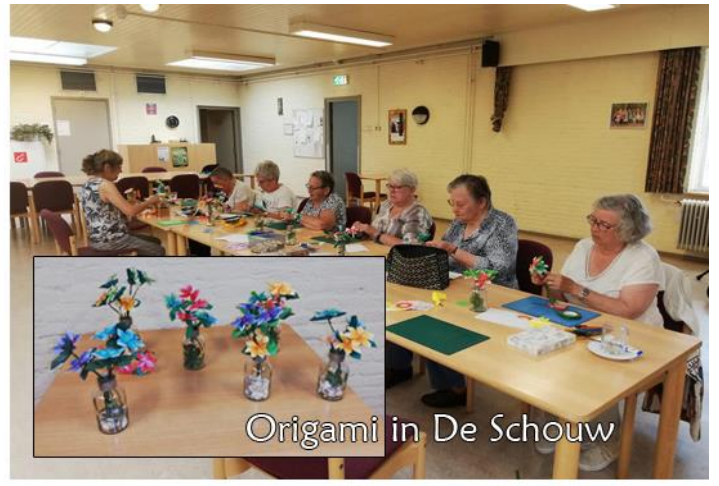
Origami in De Schouw