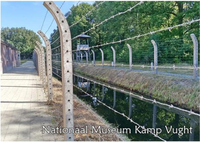
Nationaal Museum Kamp Vught