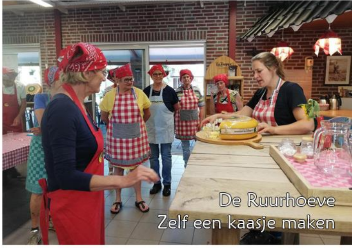
De Ruurhoeve Zelf een kaasje maken