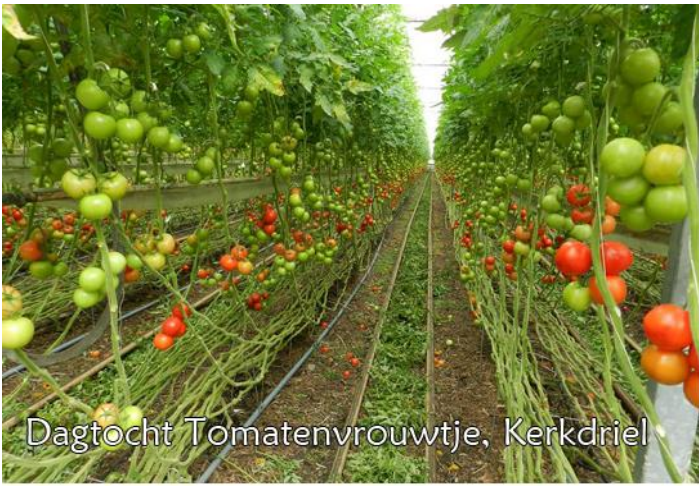
Dagtocht Tomatenvrouwje, Kerkdriel