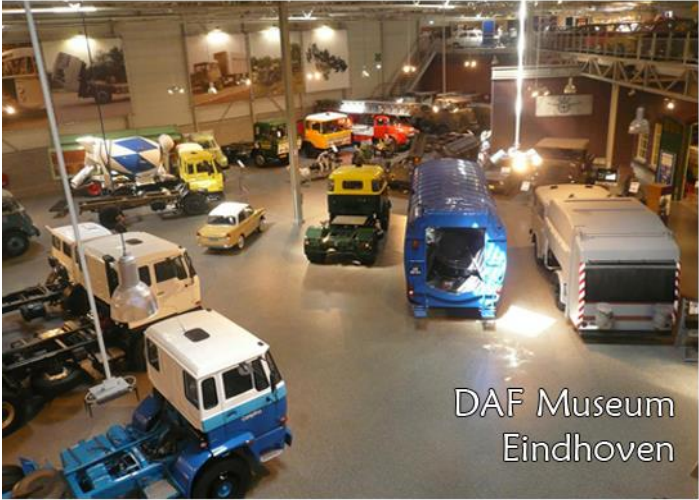
DAF Museum Eindhoven