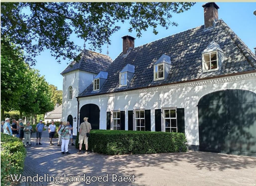
Wandeling Landgoed Baest