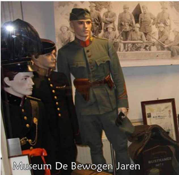
Museum De Bewogen Jaren

Uiterste inleverdatum kopij: zaterdag 17 september