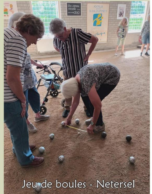
Jeu de boules - Netersel