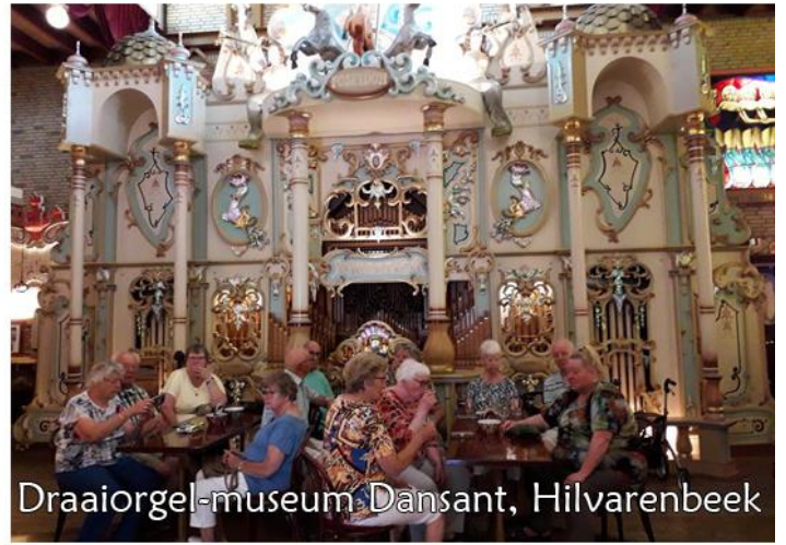
Draaiorgel-museum Dansant, Hilvarenbeek