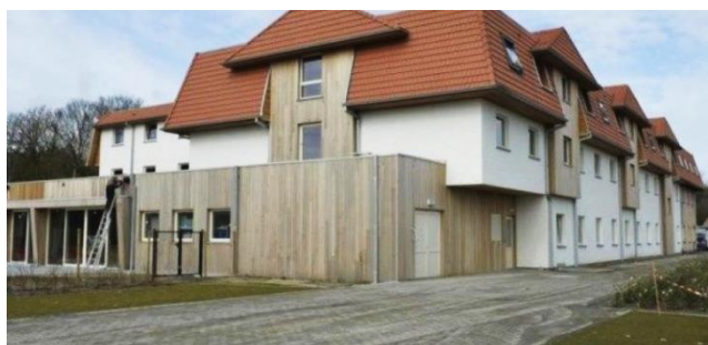
Hotel De Haan

De Lijn waaronder de kusttram valt maar ook de bus uit Reusel naar Turnhout station kunt u gebruiken met één dagkaart.