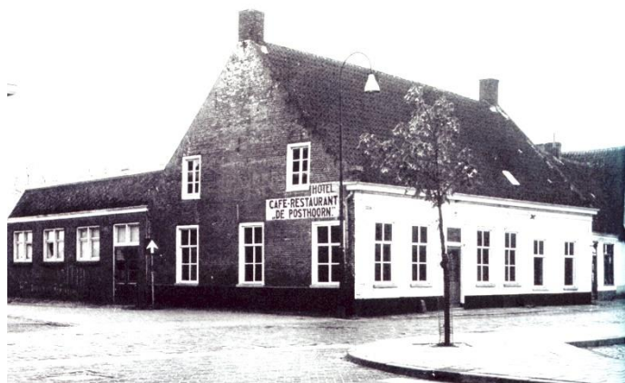
Café-restaurant 'De Posthoorn' met links de filmzaal

Veertien jaar. Eindelijk. Roken op straat toegestaan. En naar de film voor veertien en hoger. Niet meer zenuwachtig als politie Bröcheler, boom van een kerel, in de filmzaal komt controleren. Nou ja, controleren. Hij neemt plaats op de vrijgehouden politiestoel. Voorste rij middelste stek. Op rij twee zie je, achter die