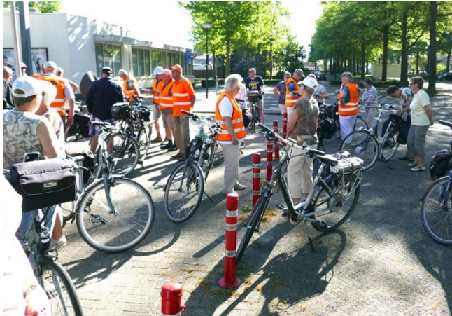
Vertrek bij de De Schouw.

De tocht werd op 1 mei verplaatst naar 8 mei omdat de weergoden toen niet meewerkten. Maar op dinsdag 8 mei hadden we heel mooi fietsweer.