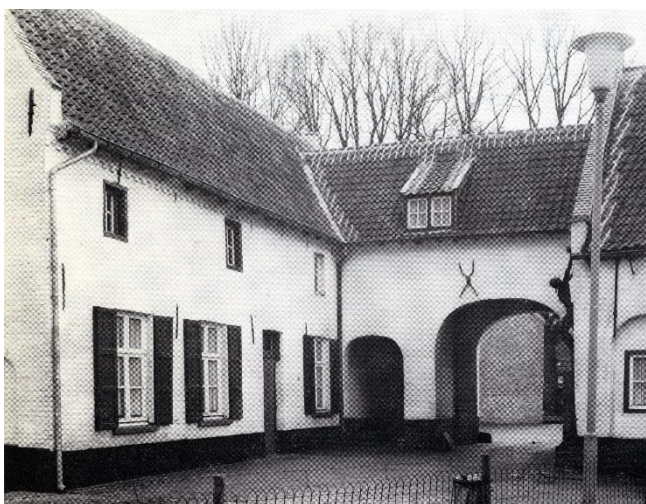
Poortgebouw met portierswoning van de Abdij van Postel, gebouwd rond 1600.

'Noodlijdenden mochten vroeger wekelijks driemaal aan de kloosterpoort aankloppen. Ze werden ruimschoots aan hun verlangen door een abdijsheer voldaan, zodat eenieder tevreden en vergenoegd naar huis terugkeerde om bij een nieuwe behoefte wederom naar Postel heen te snellen.