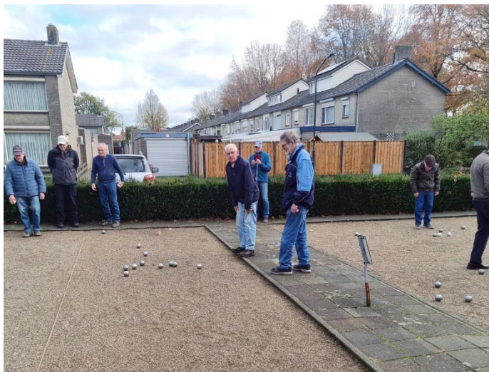
De Boulers in actie

Hierbij een update van het jeu de boules van de afgelopen maanden. We hebben nogal wat nieuwe leden erbij gekregen. Het is nu een heel gezellige groep. Jammer dat de dames het een beetje laten afweten, maar wie weet komt dat nog.