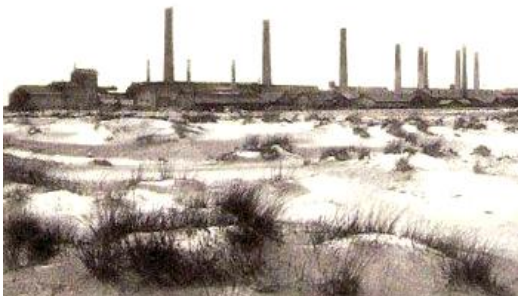
Situatie rond 1940

De Lommelse Sahara is een zand- en duinlandschap met een grootte van 193 hectare in de Belgische gemeente Lommel. In het midden ligt een meer en rondom vindt men naaldbossen. Dit landschap behoort tot het Regionaal Landschap de Lage Kempen. De Lommelse Sahara is gelegen in de onmiddellijke omgeving van het Kempisch kanaal waarover de voetgangersbrug een poort tot dit zanderig gebied vormt.